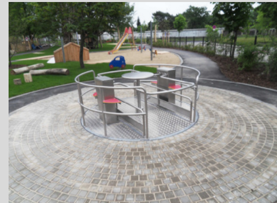
Spiel- und Freizeitgeräte